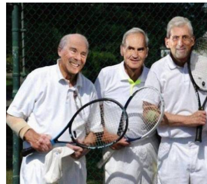
„Wielka trójka” po 70-tce

Od kilku dobrych lat świat męskiego tenisa oblega trzech dominujących tenisistów, którzy trwale zagospodzą na kartach historii. Wybitni sportowcy niezmiennie górują na miejscach światowego rankingu. Roger Federer, Rafael Nadal i Novak Đoković mają na swoich kontach kilkanaście zwycięstw w Wielkich Szlemach. Sportowców różni styl gry: Federer jest ceniony za ogromną klasę i technikę gry, Nadala cechuje determinacja oraz mistrzostwo gry na kortach ziemnych. Natomiast Đoković poprzez swój uniwersalizm, wytrzymałość psychiczną i zachwycającą gibkość jest numerem jeden.